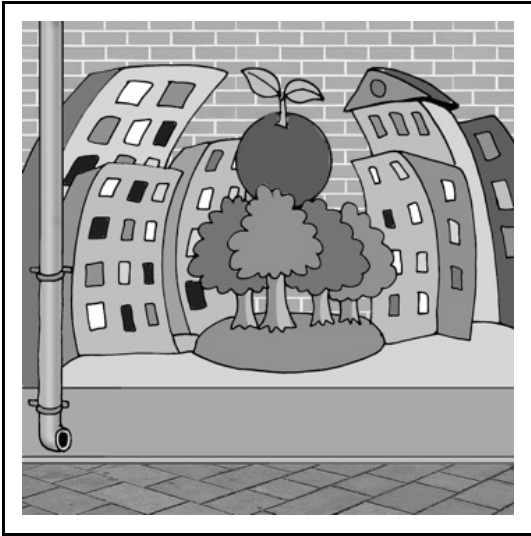
domy i drzewa